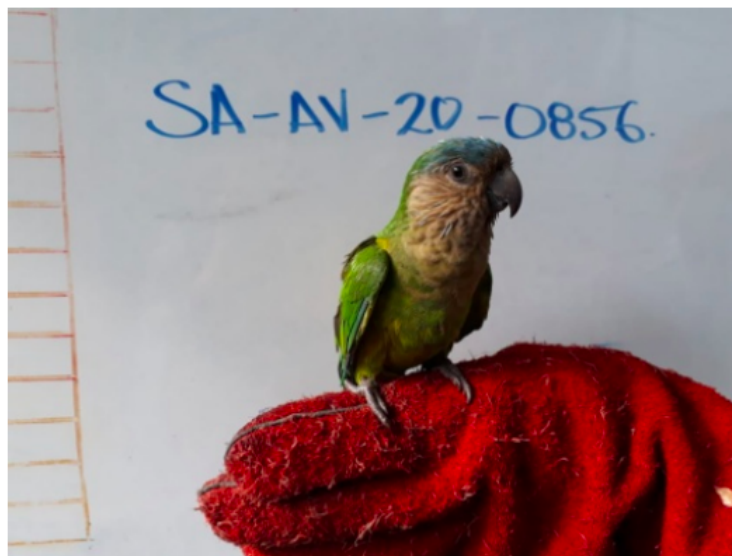
Foto 2. Valoración de individuo SA-AV-20-0856 Eupsittula pertinax (Cotorra carisucia) incautado. Acta Única de Control al tráfico ilegal de flora y fauna silvestre No. 160856.

En el momento de la valoración preliminar del espécimen, este fue individualizado con el rótulo SA-AV-20-0856. Se encontró que el individuo es un adulto joven. (Foto 2).